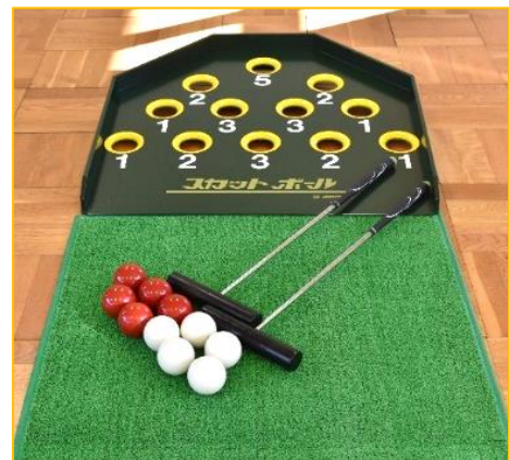
【スカットボール】 1セット