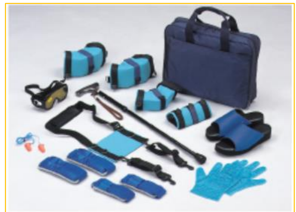
【高齢者疑似体験用具】 10セット