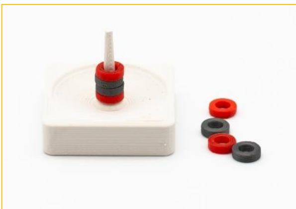
【輪投げセット】 2セット