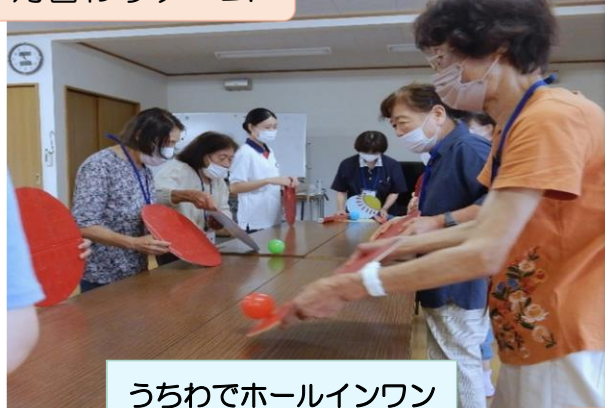
うちわでホールインワン