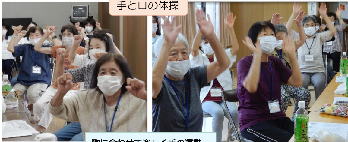
歌に合わせて楽しく手の運動