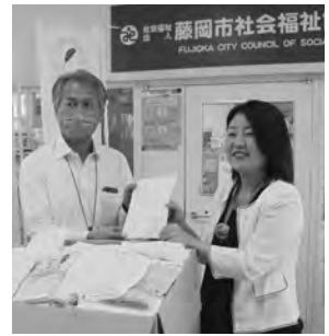
第一生命労働組合 群馬支部 (右)