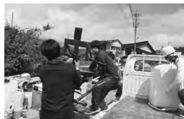
災害ゴミ置き場へ運ぶ