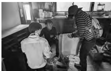
家主に確認しながら片付け