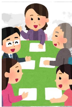
〇〇地区 地域支え合い 協議体

買い物が大変な人に、地元の商店さんが移動販売をしてくれている。でも、それを知らない人がいるかも・・・？